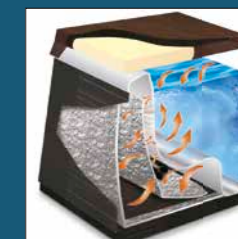
Triple Thermal Shield

Fraktfritt inom Sverige. Avser leverans till tomtgräns, inkluderar ej ev. kranlyft.