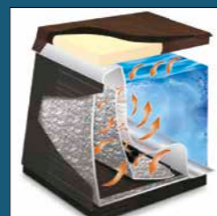
Triple Thermal Shield

Fraktfritt inom Sverige. Avser leverans till tomtgräns, inkluderar ej ev. kranlyft.