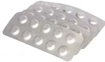
Spa Care Refillkarta till klor 10 tabletter Art.nr: 3250