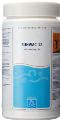
Spa Care SunWac 12 brus 100 tabletter Art.nr: 3241