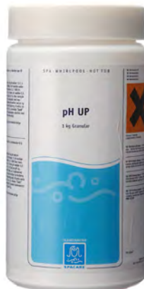
Spa Care pH Plus 1 kg Art.nr: 3236