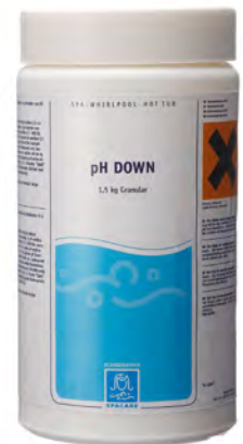
Spa Care pH Minus 1,5 kg Art.nr: 3235